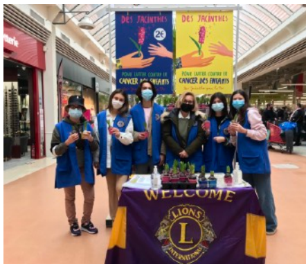
Dans les galeries marchandes du Sud Ouest

Depuis 2006, 440 000 € de dons ont été récoltés collectivement en faveur de la lutte contre les cancers infantiles, avec des actions régionales depuis 5 ans.